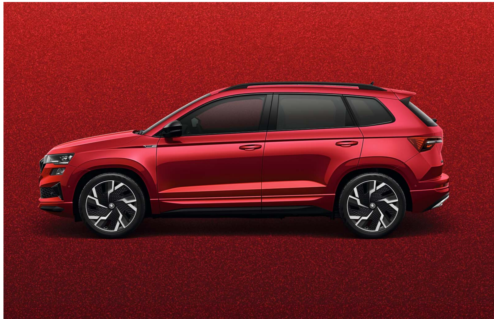
VELVET RED METĀLIKA