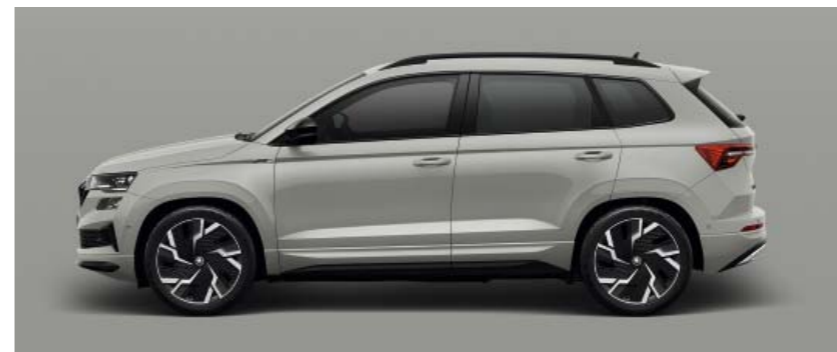
STEEL GREY UNI