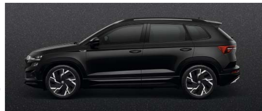
MAGIC BLACK METĀLIKA