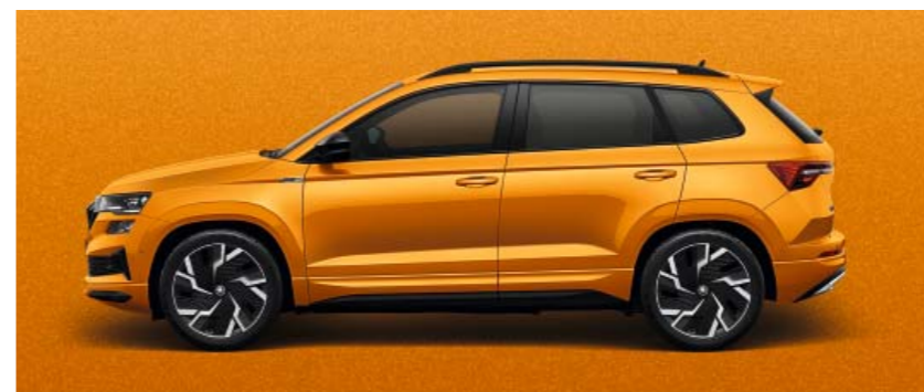
PHOENIX ORANGE METĀLIKA