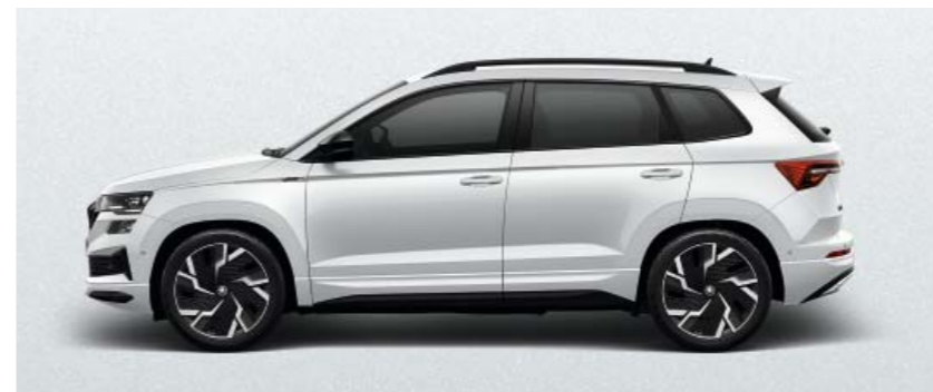
MOON WHITE METĀLIKA