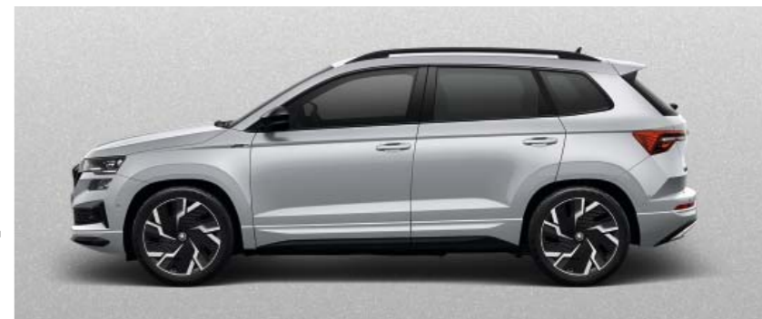
BRILLIANT SILVER METĀLIKA