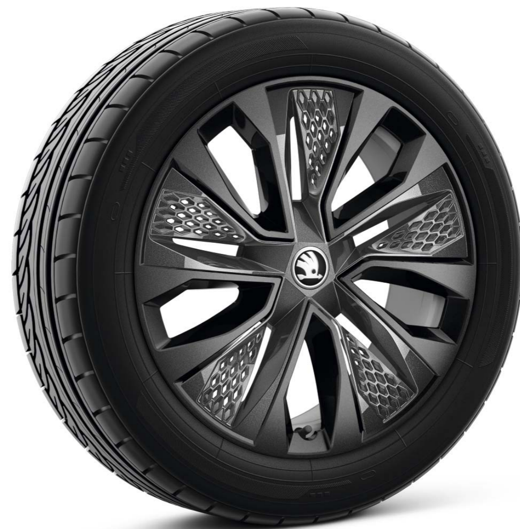
18" PROCYON melni Aero vieglmetāla diski ar antracīta uzlikām