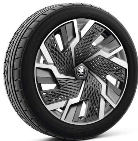
19" SAGITARIUS antracīta Aero vieglmetāla diski ar melnām uzlikām