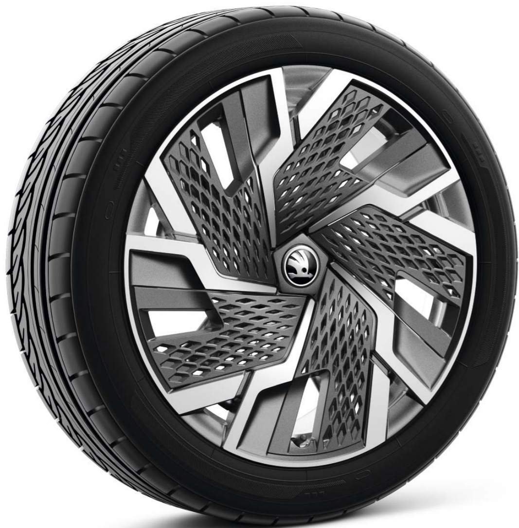
19" SAGITARIUS antracīta Aero vieglmetāla diski ar matēti melnām uzlikām