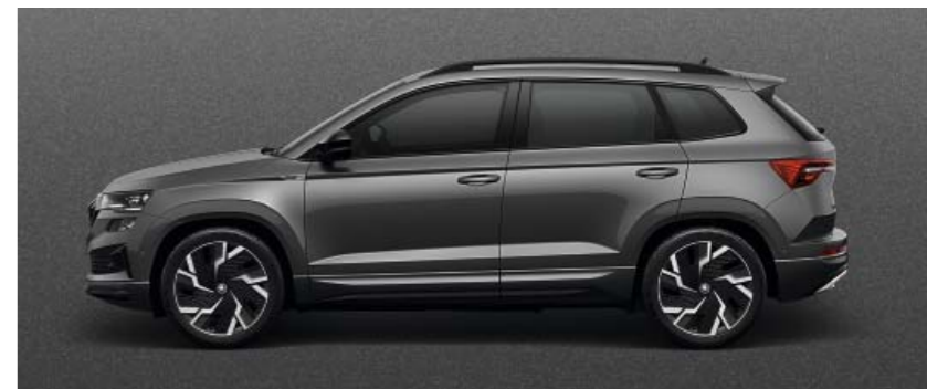
GRAPHITE GREY METĀLIKA