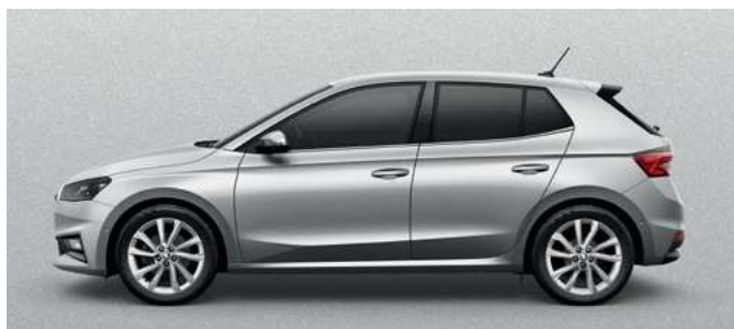
Metāliska krāsa Brilliant Silver