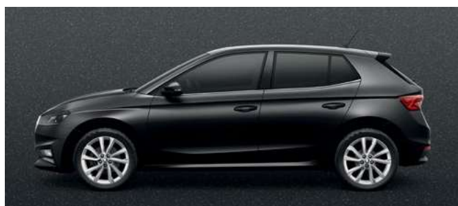
Metāliska krāsa Magic Black