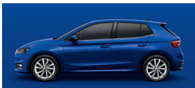
Nemetāliska krāsa Energy Blue