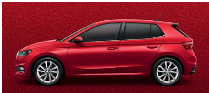
Metāliska krāsa Velvet Red