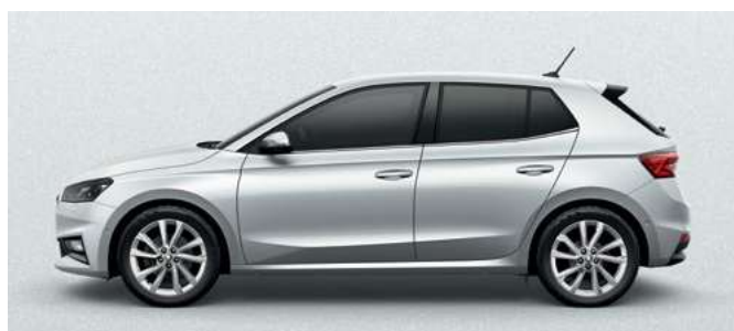
Metāliska krāsa Moon White