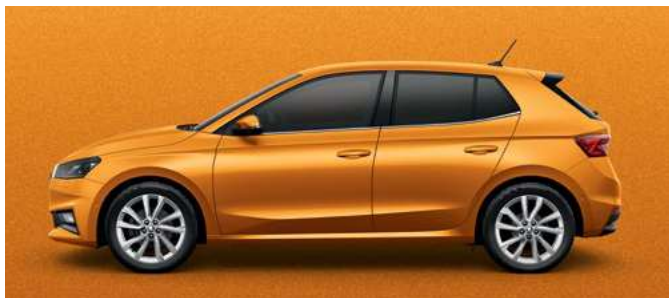
Metāliska krāsa Phoenix Orange