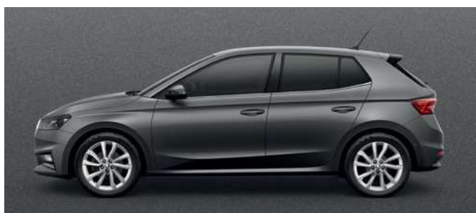
Metāliska krāsa Graphite Grey