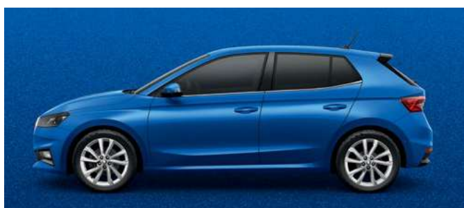
Metāliska krāsa Race Blue