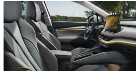
DIZAINA PAKETE "LOUNGE"