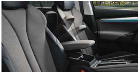
DIZAINA PAKETE "LOFT"