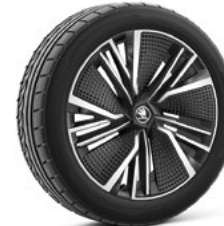
20" NEPTUNE AERO disku uzlikas 920 €