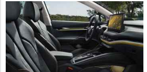
DIZAINA PAKETE "SUITE BLACK"