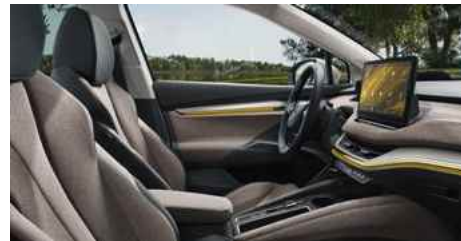
DIZAINA PAKETE "LODGE"